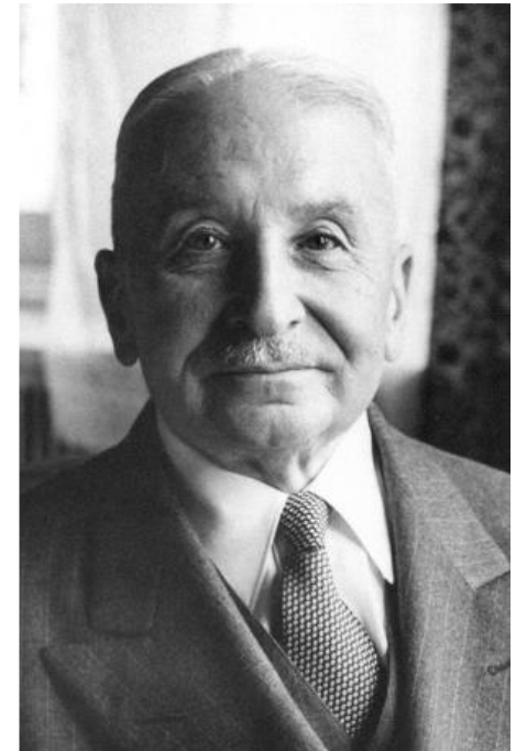
Ludwig von Mises (1881 – 1973)

Nationalökonomie – Theorie des Handelns und Wirtschaftens (1940)